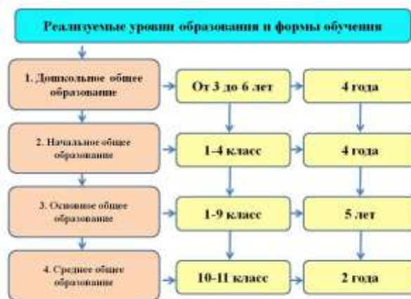
Рис.2 Реализуемые уровни образования и формы обучения.

осуществляется на бесплатной основе; частные школы также доступны, хотя и в ограниченном количестве. Частные школы в России, по сообщениям, составляли около 1 процента от всех 42 600 школ, которые существовали в России в 2019 году.