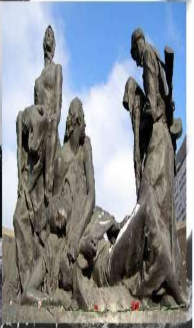
Памятник героическим защитникам блокадного