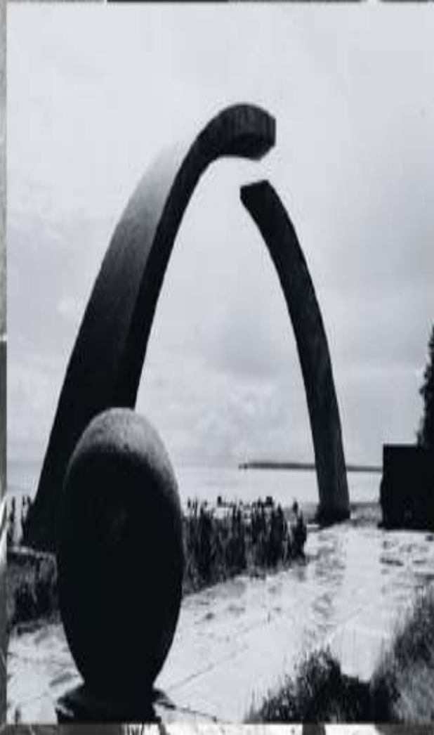
Монумент «Разорванное кольцо» в честь прорыва блокады.